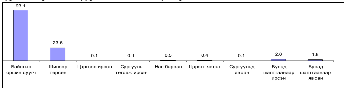
Зураг 1. Хүн амын суурьшлын байдал, хувиар

оршин суусан гэж өөрсдийгөө үзсэн хүмүүс энд мөн хамрагдсан. Хүн амын суурьшлын байдал нь өрхийн бүртгэлийн дэвтэрт 9 үзүүлэлтээр тусгагдаж байгаа бөгөөд бидний судалгаанд хамрагдагсдын тухайд дараах дүр зураг харагдаж байна.