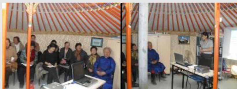
Зураг 1. Судалгааны үр дүнг хэлэлцэх уулзалт, 2011/3/11

2009/2011 онд хийсэн кейс судалгааны үр дүнг харьцуулсан мэдээллийг боловсруулж, 2011 оны 3-р сарын 11-ны өдөр орон нутгийн иргэд, хороо, сургуулийн ажилтангуудад танилцуулах, цаашид анхаарах асуудлын талаар санал солилцох уулзалтыг Нутгийн Хөгжлийн Төвийн байранд хийсэн. Уулзалтаар орон нутгийн иргэд, засаг захиргаатайгаа хамтарч өргөжүүлэн бүх хорооныхоо түвшинд тус судалгааг явуулсан аргачлалаар явуулж, мэдээлэлтэй болгох, хэсгийн ахлагч нар сургууль засвардсан хүүхдүүдийн мэдээллээ сургуулийн нийгмийн ажилтанд өгч байх зэрэг асуудлыг дэвшүүлсэн тавьсан.