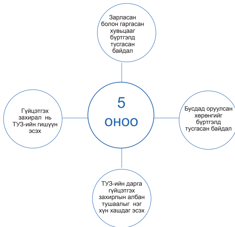
Зураг 2. Монатом ХХК-ийн засаглалын үнэлгээнд сайн үнэлгээ буюу 5 оноо авсан асуулгууд

Хэдийгээр дээрх 4 асуулгаар үнэлгээний дээд оноо авч чадсан ч үнэлгээний үзүүлэлтийн нийт 116 асуулгаас 83 буюу 71 хувьд нь “0” үнэлгээ авсан нь эдгээр асуулгын хүрээнд тус компани тодорхой зүйл хийгдэхгүй байгаа бөгөөд энэ нь тус Компанийн засаглалын түвшин доогуур гарах гол шалтгаан болсон байна. “0” үнэлгээ авсан асуулгуудын тоог үнэлгээний үзүүлэлтээр бүлэглэн Хүснэгт 2-т үзүүлэв.