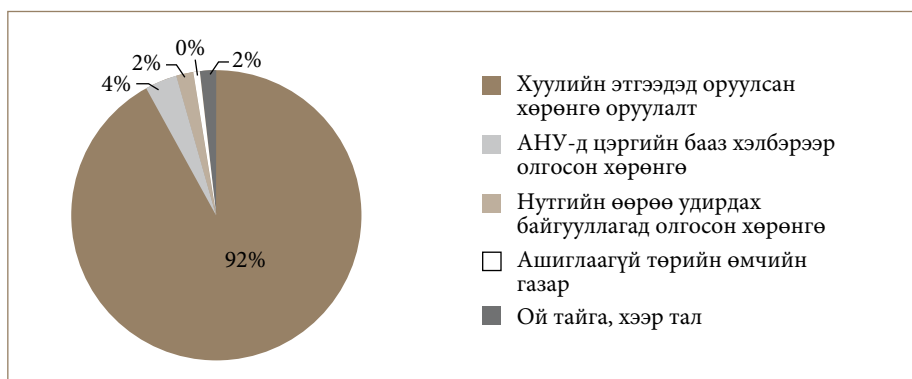
График 3. Ердийн өмчийн бүтэц (хувиар)

Графикаас харахад, ердийн өмчийн дийлэнх хэсгийг Засгийн газраас хуулийн этгээдэд оруулсан хөрөнгө оруулалт эзэлжээ. Харин бусад төрлийн өмчид хамаарах хөрөнгө нь ердийн өмчийн 0-4 хувийг эзэлж байна.