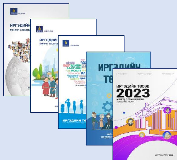
“ИРГЭДИЙН ТӨСӨВ, ТӨСВИЙН ТӨСӨЛ