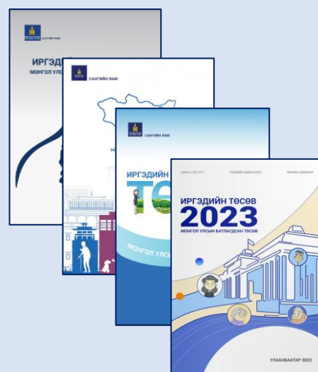
“ИРГЭДИЙН ТӨСӨВ, БАТЛАГДСАН ТӨСӨВ