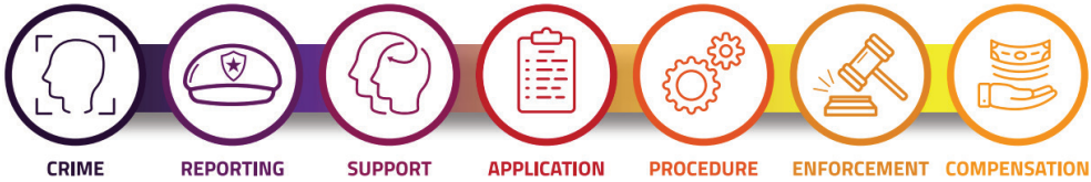
График 2.3. Хохирол нөхөн төлүүлэх процесс

Гэмт хэргийн хохирлын нөхөн төлбөр авах гомдол, мэдээлэл гаргах эрх нь: