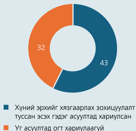
График 8. Хууль тогтоомжийн үр нөлөөний үнэлгээний хүрээнд хүний эрхийн нөлөөллийг үнэлсэн байдал

Дээрх 75 хуулийн төслийн үр нөлөөний үнэлгээний тайлангийн 32 нь дээрх асуултад огт хариулаагүй. Харин үлдсэн 43 нь ямар нэгэн байдлаар хариулсан байх боловч хариулт нь ихэвчлэн “хүний эрхийг хязгаарласан зохицуулалт тусгагдаагүй”, “үгүй”, “тусгаагүй”, “шаардлага хангасан” зэрэг гэх мэт ерөнхий байна. Тэрчлэн ийнхүү хариулсан шалтгаан үндэслэлийг тайлбарласан, нотолсон тохиолдол байхгүй нь энэ төрлийн судалгаа мөн л зохих ёсоор хийгдэхгүй байгааг харуулж байна.