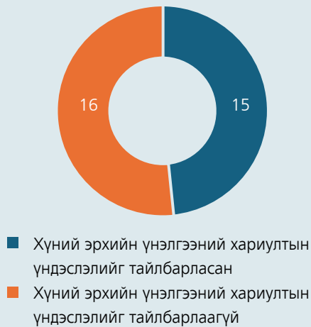
График 6. Хүний эрхийн нөлөөллийн үнэлгээний асуултад хариулсан байдал

Хүний эрхийн үнэлгээний асуултад хариулсан байдлыг авч үзвэл, дээр дурдсан 31 хуулийн төслийн зөвхөн 15-д нь хүний эрхийн нөлөөллийн үнэлгээний 5 бүлэг, 17 асуултад зохих тайлбартайгаар хариулжээ. Гэсэн хэдий ч тухайн хариултын үндэслэлийг тодорхойлох мэдээ, баримт тайланд тусгагдаагүй тул үнэлгээний чанар, үндэслэл бүхий байдалд дүгнэлт өгөх боломжгүй байв. Тэрчлэн тайлбар нь хэт ерөнхий буюу “хуулийн төсөлд хориглосон зохицуулалт байхгүй”, “хуулийн төсөлд хүний