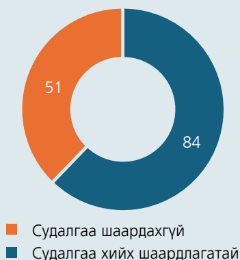
График 2. Өргөн мэдүүлэгдсэн хуулийн төслүүд: Судалгаа хийх шаардлагатай эсэх

Судалгаа хийх шаардлагатай 84 хуулийн төсөлд суурь судалгаа буюу хууль тогтоомжийн хэрэгцээ, шаардлагын тандан судалгаа болон