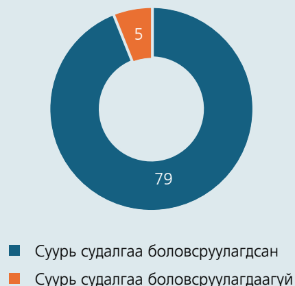
График 4. Суурь судалгааны төрөл