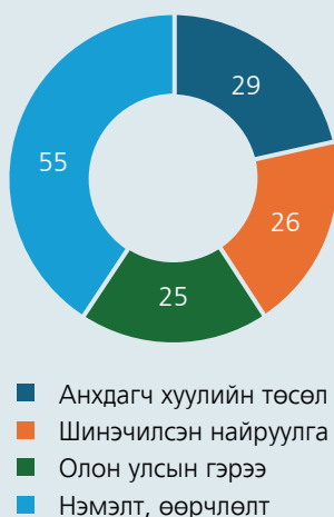
График 1. УИХ-д өргөн мэдүүлэгдсэн хуулийн төслийн төрөл (2023.01.01-2024.06.30)

Иймд цаашид уг судалгааны агуулгыг шинэчлэн тогтоож, хүчин төгөлдөр үйлчилж буй хуульд нэмэлт, өөрчлөлт оруулах эсэхийг шийдвэрлэхийн өмнө тухайн хуулийн хүний эрхэд үзүүлж буй нөлөөллийг заавал нарийвчлан тогтоох шаардлагыг хуульчлах нь зүйтэй.