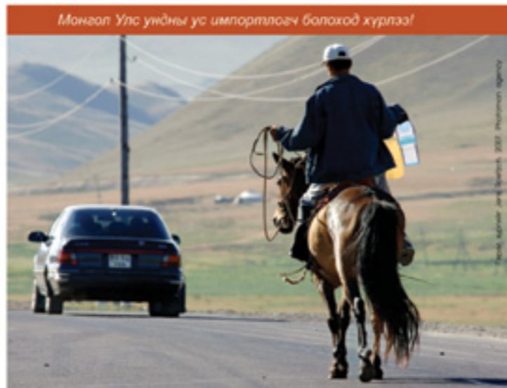
Монгол Улс ундны ус импортлогч болоход хүрлээ!

Хаврын тэнгэр мэт таахын аргагүй хувь заяандаа Заяа хэдийнэ эзэн нь биш болжээ. Бүх зүйлд бэлэн хариулт, бэлэн хоол хүртээд сурчихсан Заяагийн амьдралд хуй салхи мэт гэнэтийн оорчлолт хэрэгтэй гэж аав нь бичсэнгийг тэр мэдэх болов уу?