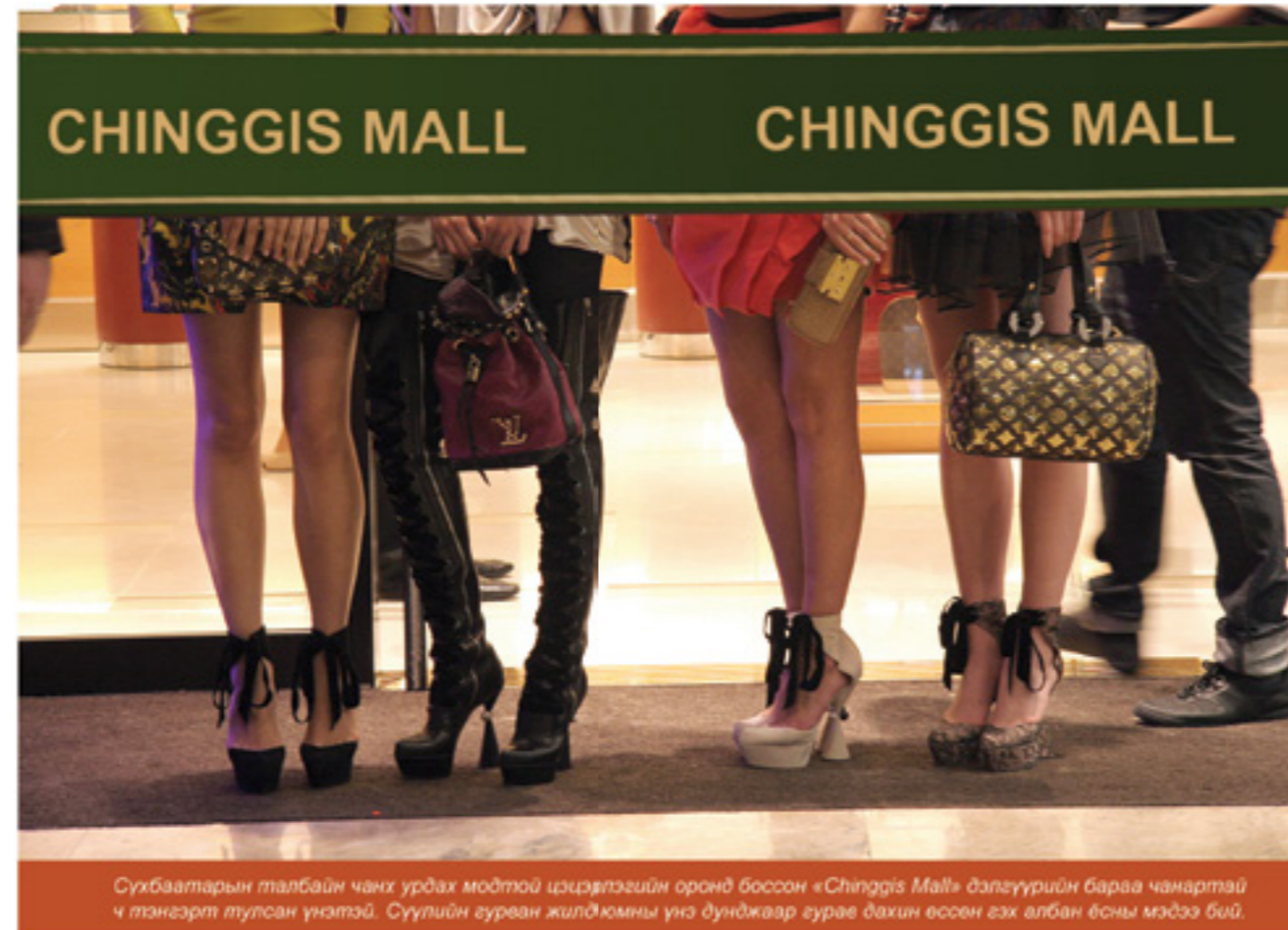
Сүхбаатарын талбайн чанх урдах модтой ирцэвчлэгийн оронд боссон «Chinggis Mall» дэлгүүрийн бараа чанартай ч тэнгэрт тулсан үнэтэй. Сүүлийн гурван жилд юмны үнэ дунджаар гурав дахин өссөн гэх албан ёсны мэдээ бий.

Заяа маргааш нь соёлон насны морьдын уралдаан үзэхээр Хүй долоон худагт очлоо. Улсын