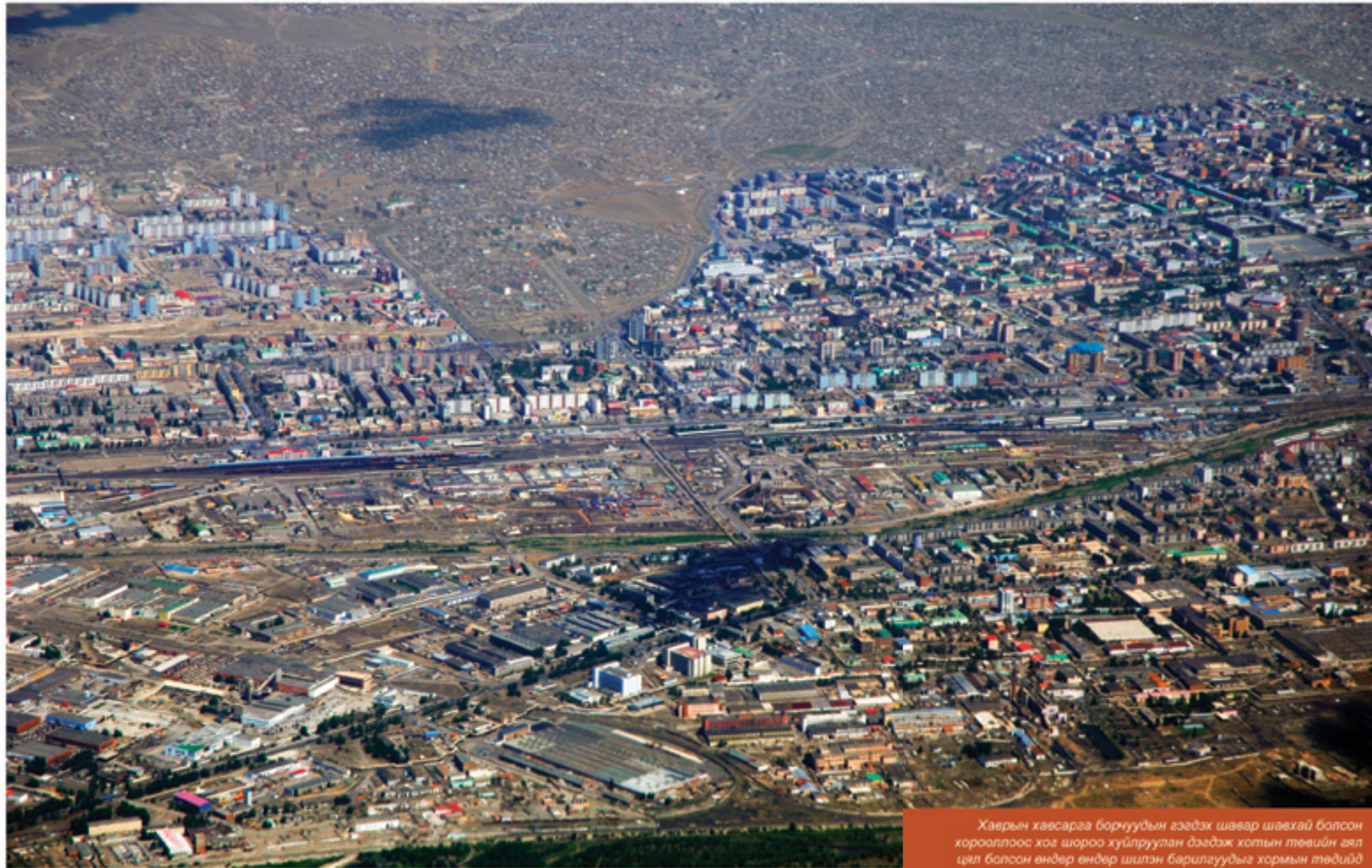
Хаврын хавсаргаа борнуудын гээдэх шавар шавхай болсон хорооллоос хог шороо хуйлруулан дээдэж хотын төвийн гял цил болсон өндөр өндөр шилэн барилгуудыг хормын төдийд халтартуулах нь харамсмаар... Салхинаас өөр ижилсэх зүйлгүй эрс тэс энэ хоёр өртөнцийг нийтийн орон сууцны нэвсгэр хороолол зааглан оршино.

2 Төв талбайд зарласан эсэргүүцлийн жагсаалд оролцогчид улам бүр нэмэгдсээр үд гэхэд талбай бараг шиг дүүрэн. Жагсагчид төв хэсэгт зассан тайзан дээр ээлжлэн гарч үг хэлж буй хүмүүсийн үгийг уухайлан давтах бөгөөд “Монгол хүн Монголдоо Европыхоос үнэтэй мах идэх ёсгүй”, “Байгалийн баялгийг ард түмний мэдэлд”, “Амлалтаа биелүүлж тэтгэмжийг нэм” гэх мэт уриа лоозон барьжээ. Заяагийн хувьд халамжийн мөнгөө