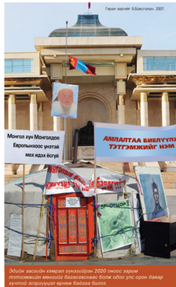
Эдийн засгийн хямрал гүнзгийрэн 2020 оноос зарим тэтгэмжийн мөнгийг багасгаснаас болж одоо улс орон даяар хүчтэй эсэргүүцэл өрнөж байгаа билээ.

тайлбарласан. Харин намынхан нь татвар нэмнэ гэдэг бол өөрсдийнхөө халаас руу гараа дүрсэнтэй ялгаагүй хэрэг болох тул нөгөө аргыг нь нэгэлт сонгожээ. Бодлого, шийдвэр ниймэрхүү маягаар гардаг болоод ч тэр үү олон улсын судалгаагаар Монголын засаглалын үзүүлэлтүүд буурсаар л байна. Нийтийн эрх ашигт нийцэхгүй шийдвэр гаргах явдлын эсрэг тэмцэх ёстой сөрөг хүчин гэж байхгүй, нам дамнасан олигархи бүлэглэлүүд улс төрийг хянаж, иргэний нийгэм улстөрчдийн халаасны хүүхэддэй болж, ард түмэн нь халамжийн мөнгөөр тэжээлгэхийг урьтал болгосон хүлцэнгүй, идэвхгүй болсон нь 300 гаруй жилийн өмнөх Манжийн дарлалын үеийг эрхгүй санагдуулна.