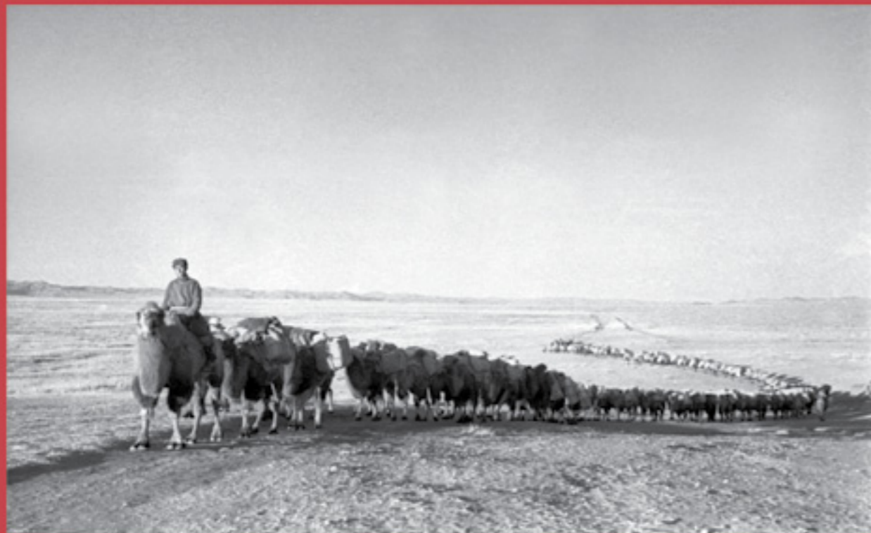
Гарал зурвалж: Д.Давсжав, 1942, Photo.com agency

наадамд албан ёсоор зөвхөн эрлийз морьд уралддаг болсон тул дүүхэлтсэн өндөр морьд тоос татуулан бариад оров. Айргийн тавд орсон соёлогчдын гурав нь УИХ-ын гишүүдийн, хоёр нь уул уурхайн компаниудын захирлынх байсан бөгөөд урьдхнх шиг жийнээр биш 999-ын сорьцтой цэвэр алтан гулдмайгаар байлаа. Монгол морьд уяачдын наадмаар уралддаг сурагтай.