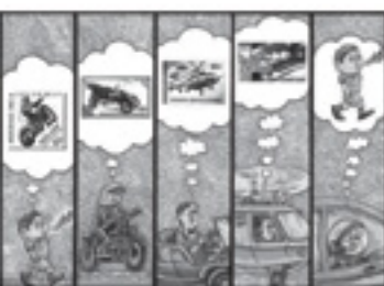
Монгол улсад уул уурхай, түүнийг дагасан үйлчилгээ, зугаа цэнгээн болон барилгын салбараас бусад бүх салбар хөгжсөнгүй.