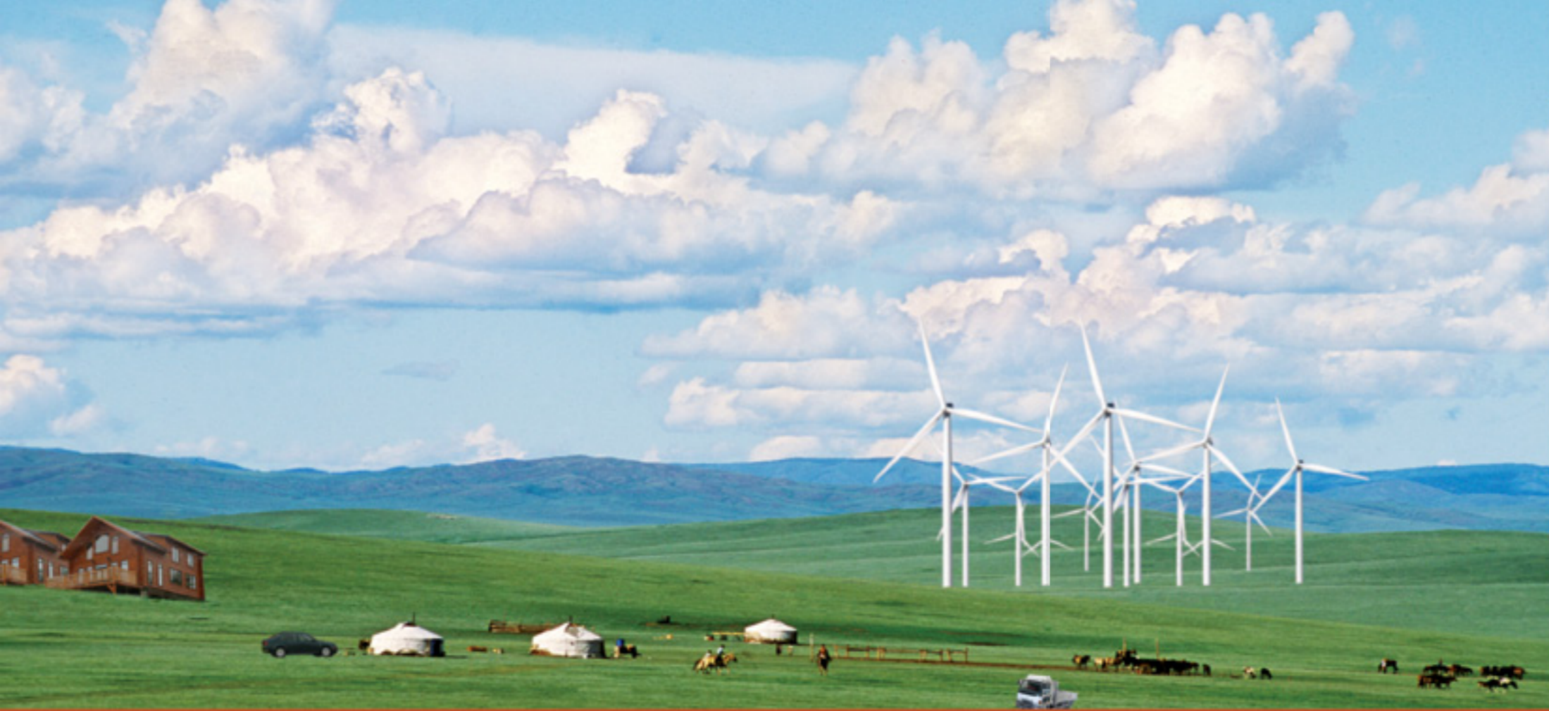
Хөдөөд айлын өвөлжөө хүртэл цахилгаантай болж, зам харгүй сайжирчээ. Байгальд нөхөн сэргээлт хийснээр XIII зууных шиг л атар онгон болсон байна. Малчид боловсрол сайтай болцгоож, малын эмч, технологич мэргэжилтэй хүмүүс их олширлоо. Хуурай сүү, айраг, экологийн цэвэр борц гээд хийхгүйд юм алга.

Тусламж үзүүлж: Р.Зайсан, 1988, Photo.com agency