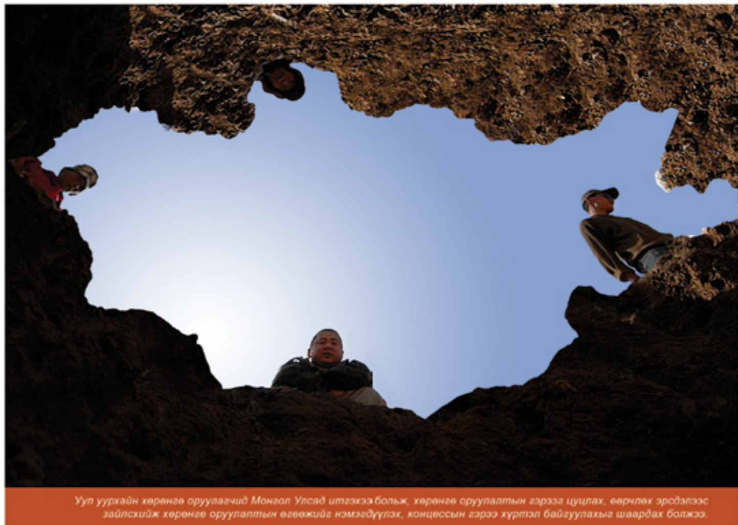
Уул уурхайн хөрөнгө оруулагчид Монгол Улсад итгэхээ больж, хөрөнгө оруулалтын гэрээг цуцлах, өөрчлөх эрсдэлээс зайлсхийж хөрөнгө оруулалтын өгөөжийг нэмэгдүүлэх, концессын гэрээ хүртэл байгуулахыг шаардах болжээ.

Заяагийн санаж байгаагаар 2012 оны сонгууль дахин мөнгөний сонгууль болж улс орны хувь заяа эргэлт буцалтгүй буруугаар эргэхэд хүрчээ. Бэлэн мөнгө амлаж улс орныхоо хөгжлийг баллахгүй гэж ам өчгөө өгсөн улс төрийн хоёр том хүчин хэлсэн үгэндээ хүрсэнгүй. Тэд сонгууль болохоос хоёр