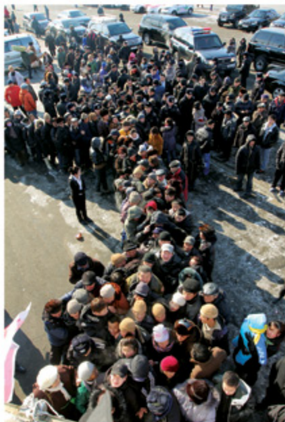
Малчдын сана Чингис хаан сан болгон өөрчилж, иргэн бүрт сар бүр 500 мянган төгрөг, хүүхэд бүрт 300 мянган төгрөг өгөх журам гарчээ.

сайхан амьдрал ирнэ гэж найдаад явж байлаа. Гэвч гай газар дороос гэдэг шиг 2018 оны сүүлээр эдийн засгийн хямрал эхэлжээ. Аль 2013 онд байгуулсан Төсвийн тогтворжилтын сангийн мөнгийг эхлээд малчдад, дараа нь өндөр настан болон хүүхдүүдэд, сүүлдээ иргэн бүрт бэлнээр тараах хөтөлбөрүүдэд дайчлан шавхчихаад байсан тул энэ хямралтай нүүр тулахад ямар ч бэлтгэлгүй байсан Монголын эдийн засаг шууд сөхөрч эхлэх нь тэр. Эдийн засгийн хямрал гүнзгийрэн 2020 оноос зарим тэтгэмжийн мөнгийг багасгаснаас болж одоо улс орон даяар хүчтэй эсэргүүцэл орнож байгаа