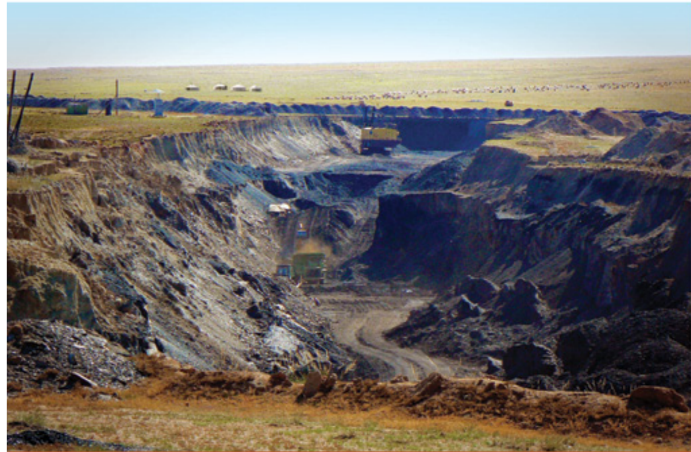
Гапон Иорвик /Jawelky, 2010. Getty Images

Монголын төрийн албан хаагчид болон Дэлхийн банкны шинжээчид улс төрийн намуудад Хятадын нүүрсний импорт багасна гэж анхааруулж байсан ч нүүрсний экспортоос олох орлогын хэмжээ огцом буурахад засгийн газар огт бэлтгэлгүй байлаа. Засгийн газар төсвийн их хэмжээний алдагдалд орж, ээлжит бэлэн мөнгөө тараахын тулд маш ихээр мөнгө хэвлэх болсноор инфляци хяналтаас бүрэн гарчээ. Инфляцийн хэмжээ 12 хувь байгаа мэтээр албан ёсоор зарлах авч үнэндээ 30 гаруй хувьтай байх болсоор удаж байгаа юм. Хувийн хэвцлийн компаниуд 10-аад жилийн өмнө уул уурхайн ирээдүйн орлогод найдан ихээхэн