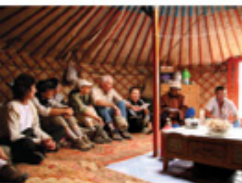
France: AFP/Arnaud Lecoq/Arnaud Lecoq, 2008.

Бэлчээр хувиулах тухай хууль хэрэгжиж эхэлснээр Төв Азийн их тал нутагт хэдэн мянган жил оршсон бэлчээрийн мал аж ахуй, үүнийг дагаад дэлхийд цорын ганц гээддэг нүүдлийн соёл иргэншил мөхөх замдаа оржээ.