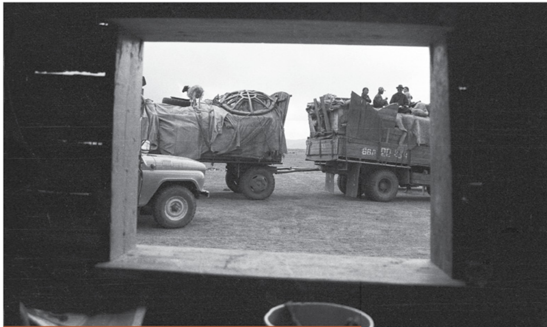
2012-2017 онуудад дэс дараалан болсон ган, хуурайшлын нөлөөллөөр цөлжин, байнгын урсгалт гол горхи ширгэж алга болсноос үүдэн өмнөд болон баруунаас төв рүү чиглэх нүүдэл ихэсжээ.

ажилладаггүй бөгөөд шүүхийн шийдвэр нь гэрээ, контрактын үндсэн дээр гардаггүйгээс хойш хийх нь утгагүй юм шиг гэрээ хэлцлийг боловсруулан цагаа өнгөрөөнө.