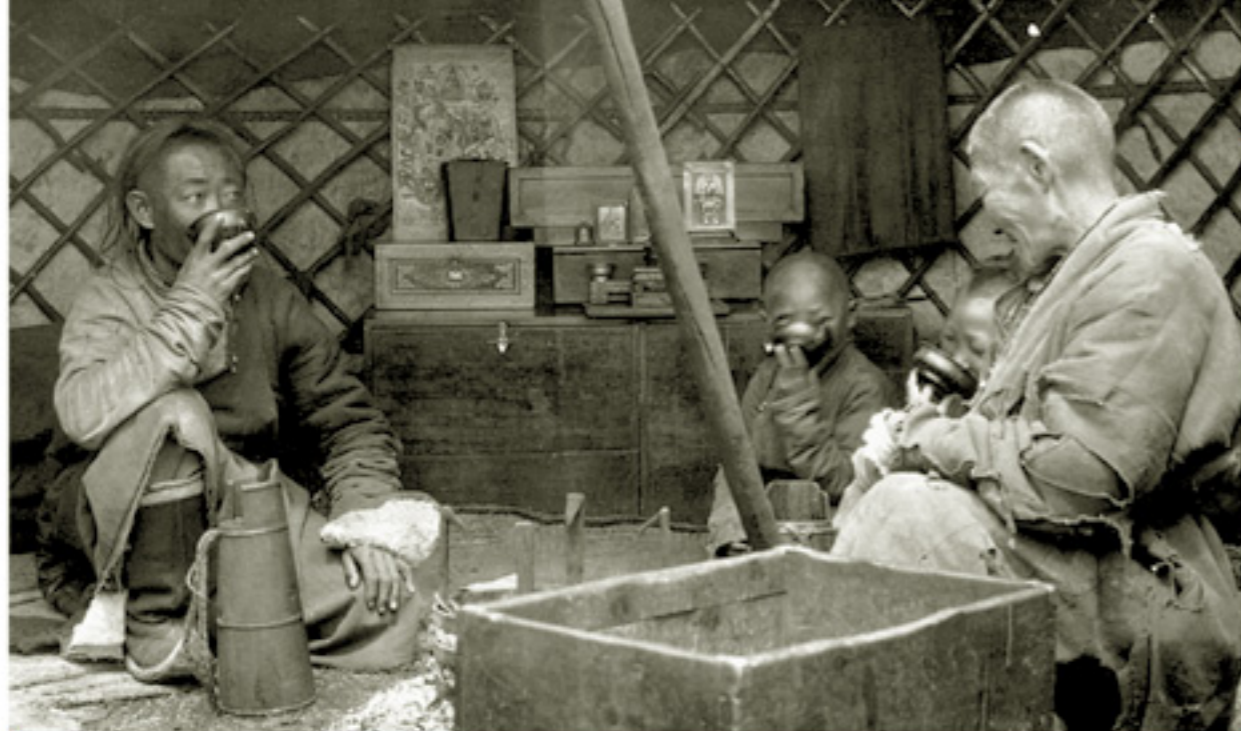
Гарал зургийг С.Ч.Эвээс, 1911 он, Photoman agency