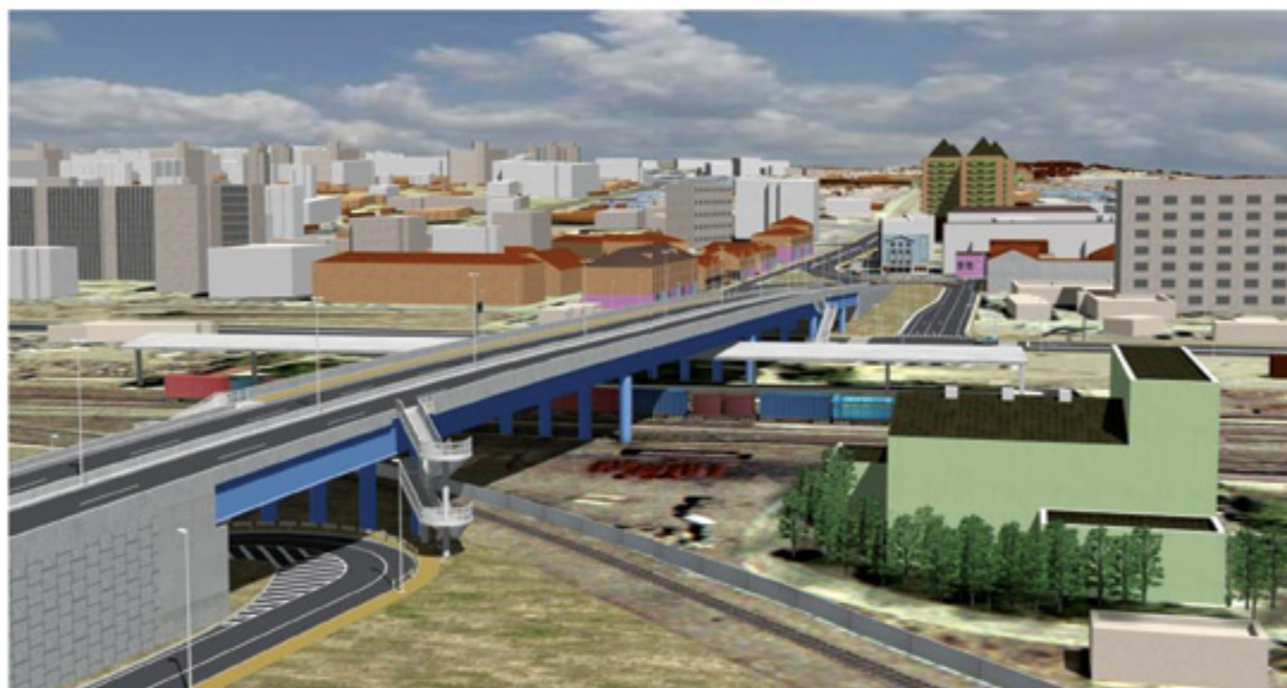
“Нэрэм гүүр” төслийн зураг, 2012.

манай орон дангаараа олборлож барахгүй байсан тул гадаадын том компаниудтай хамтран ашиглах гэрээ хэлцэл хийгдсэн. Эхэндээ бид их барьц алдсан. Энэ их баялгаа ашиглах мэдлэг туршлага ч байсангүй. Дээрээс нь өвсгөө самбаатай улсууд амин хувийн эрх ашгаа их амжуулцагасан. Эдийн засаг өсөөд байсан хэргээ хүн ард нь ядуу хэвээрээ л байв. Баялгаа худалдаж, ухаж богино хугацаанд их мөнгө олсон хүмүүс төр засагт их нөлөөтэй